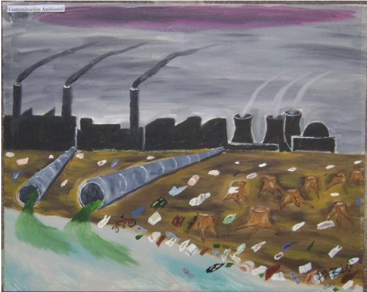
« El Incomprendido » (argentino), 2008